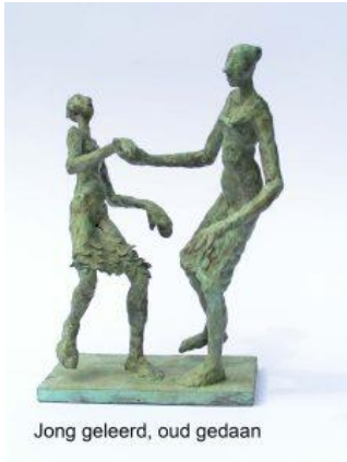
Jong geleerd, oud gedaan