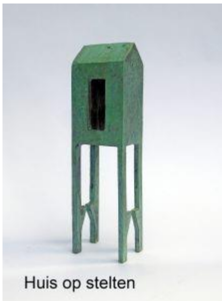
Huis op stelten

Aanvankelijk stond de menselijke figuur centraal, later kwamen er andere onderwerpen bij. Maar soms maak ik nog eens een uitstapje naar de 'mens' omdat dat vormenspel eindeloos mooi en inspirerend is.