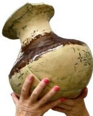
Met ringen opgebouwd.