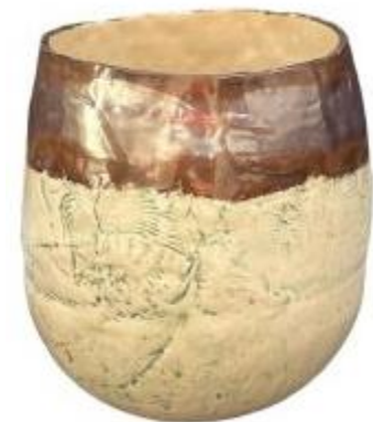
Met ringen opgebouwd.