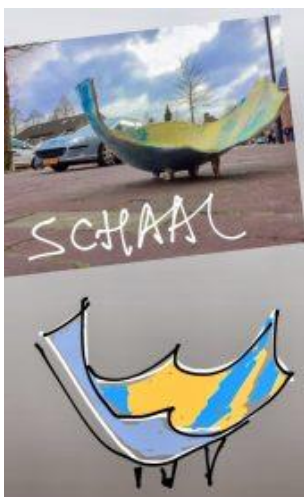
Schaal met ontwerp