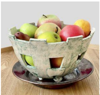
Het bord is gedraaid, de fruittest is met repen klei gebouwd