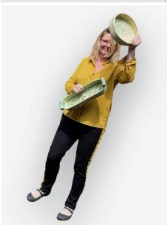
Elja met 2 schalen