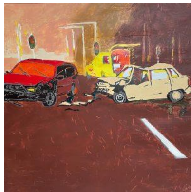
[in de prak] Een polaroid van de ambulance chauffeur zat in mijn geheugen, toentertijd geschilderd. Iverf op doek.