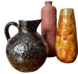
Dit heb ik gemaakt toen ik 11 jaar was. Met ringen opgebouwd.

Mijn werk ontstaat met plezier, aandacht, oog voor detail, liefde voor het ambacht en vanuit kennis en ervaring.