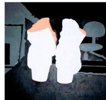
Acrylverf op doek.