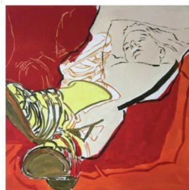
Acrylverf op doek