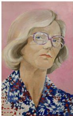
[portret van mijn moeder] Heb ik geschilderd op mijn 19de. Acrylverf op resthout.