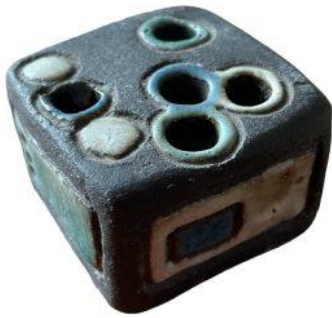
Hip in die tijd: een sigaretten dover. Ik heb er heel veel gemaakt in de werkplaats bij Hannie.

Ik woon en werk in het centrum van Zevenaar, het hart van de Liemers, in het mooiste straatje, tegenover de historische kasteelboerderij van Landgoed Huis Sevenaar . Bij mijn werkplaats heb ik een winkeltje met eigen werk, zoals: schilderijen, tekeningen, keramiek waaronder gebruiksgoed en hebbedingen. Kom gerust eens binnen!