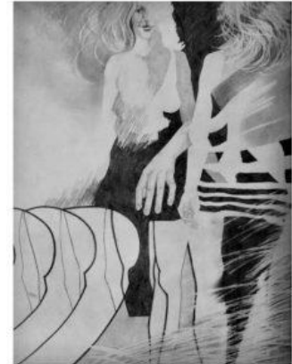
[13-17 jaar] In die tijd experimenteerde ik onder meer met het suggereren van beweging. Potlood op papier.