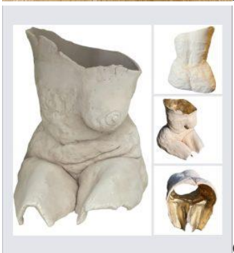
Opgebouwd uit porselein gemengd met vlas