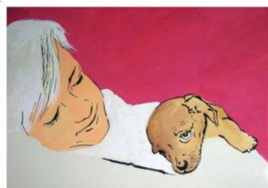
Acrylverf op papier.