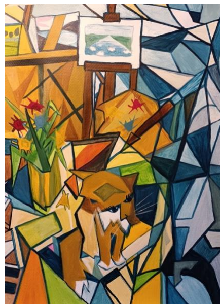
Kat in het atelier

Op dit moment exposeer ik samen met mijn vader, nog tot 3 februari, in het verpleeghuis Liemerije in Zevenaar op de Hunneveldweg 12. Alle dagen van 8 uur 's ochtends tot 8 uur 's avonds te bezoeken, ook in het weekend.