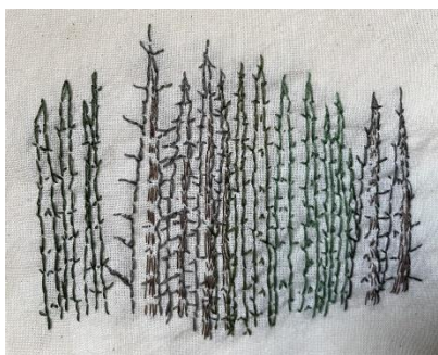
Dennenbos, DMC garen op katoen, 12 x 18 cm