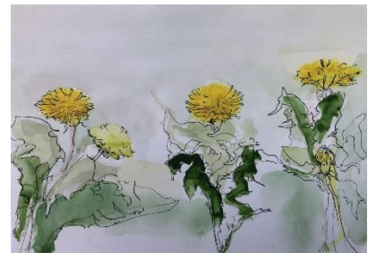
Paardenbloemen, Aquarel, 29,7 x 21 cm