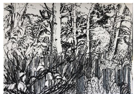
Elfenbosje, O.I. Inkt, krijt, 14,5 x 10 cm