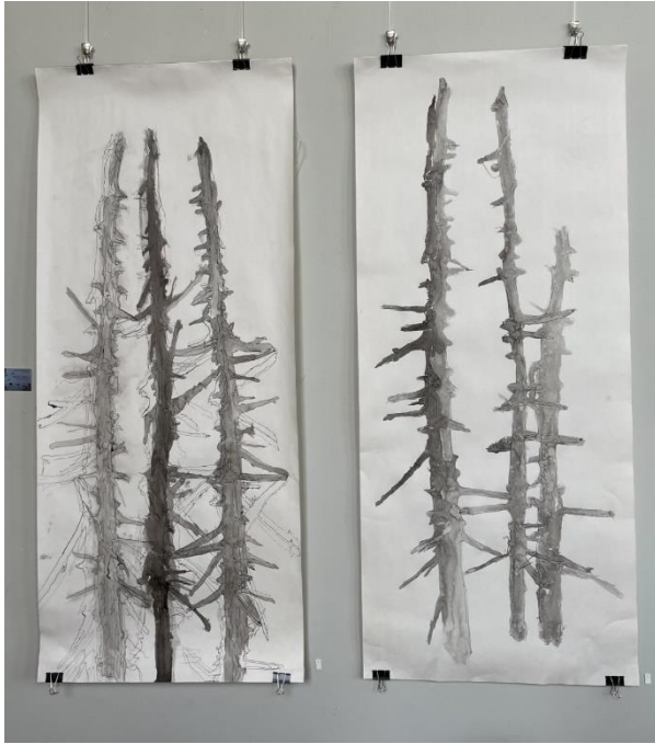
Dennentakken, Oost-Indische inkt, 150 x 62 cm

Materialen waarmee ik werk zijn: potlood, Oost-Indische inkt, aquarel en acrylverf, op diverse soorten papier en textiel. Door de jaren heen heb ik een eigen kleurenpalet ontwikkeld.